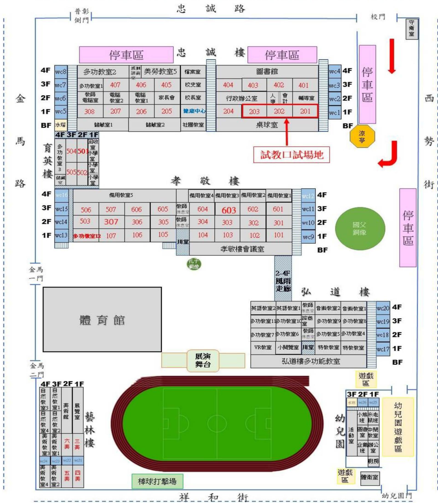
彰化縣忠孝國小114學年度校園地圖